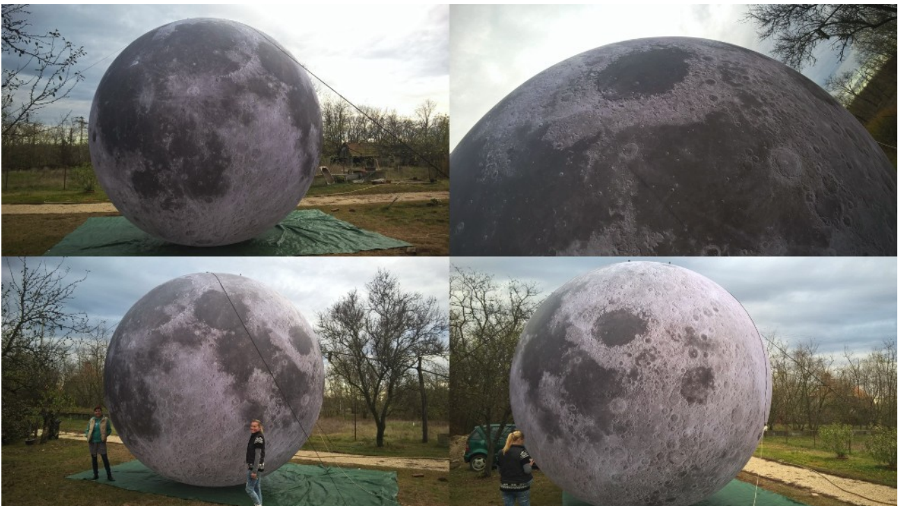
5m-es reklám gömb - Hold